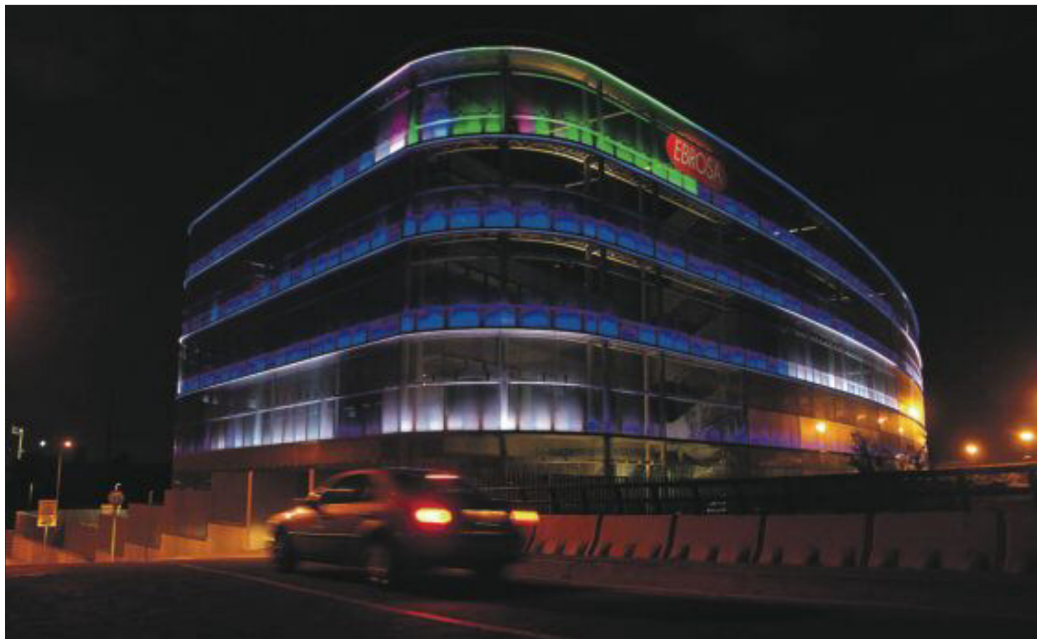
El edificio de las oficinas Ebrosa iluminado con miles de bombillas de bajo consumo por la noche.

aunque la suya “se puede usar para lo que quieras”, prefiere la iluminación “más abstracta”. De momento hay cuatro secuencias preprogramadas que se disparan cada media hora de las nueve a las doce de la noche. Todas son dinámicas y dan la vuelta a la cinta abierta de la doble piel, como si reflejasen el flujo continuo de los faros de los coches en la carretera. En Amanecer, los leds se tiñen de rojos, naranjas y amarillos para emular al sol en movimiento, en Meteoro parece que llueve luz y en Mondrian, la favorita de Lamela, el edificio se convierte en uno de los simétricos y colorista cuadros del pintor holandés. Sobre algunos de los vi-