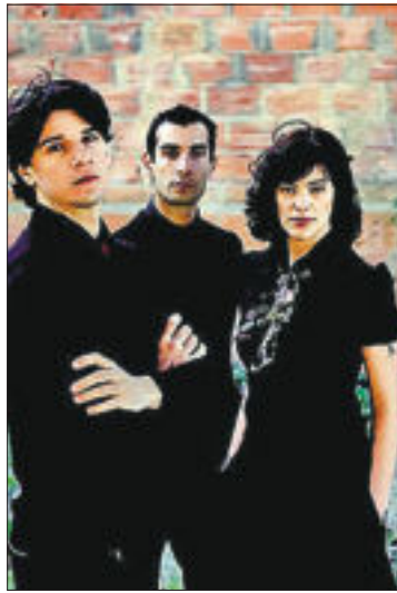
El grupo portugués The Gift actúa en el centro Fnac de Callao.

19.00. Explode . Actuación en directo. FNAC CALLAO. PRECIADOS, 28. LIBRE.