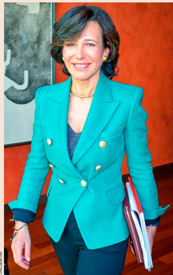
Ana Botín, presidenta de Santander, ayer.

La subida de Santander tira de los bancos en Bolsa P16