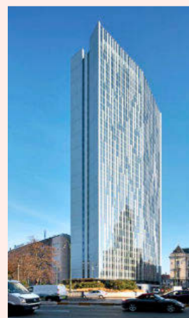
Torre Astro, en Bruselas (Bélgica).

Torre Astro, ubicada en Bruselas (Bélgica) y rehabilitado por Estudio Lamela y sus socios belgas Altiplan Architects, se inaugurará el próximo lunes. Este rascacielos, con 112 metros de altura, 40 plantas –32 de oficinas, 3 plantas técnicas y 5 sótanos– y 52.627 metros cuadrados, será el edificio verde más alto de Europa con mayor eficiencia energética. El proyecto de rehabilitación del rascacielos, con un presupuesto de 55 millones de euros, pretende ajustarse a los parámetros actuales de eficiencia energética y renovar el skyline de la ciudad con una arquitectura moderna. Torre Astro contará con la certificación Bâtiment Passif, lo que confirma que es un edificio autosuficiente energéticamente casi por completo. Torre Astro, construida en 1974 por el arquitecto Albert Donker, será la sede central de Actiris, un organismo público que se encarga de ayudar a encontrar empleo en la región de Bruselas y que centralizará su actividad en este edificio.