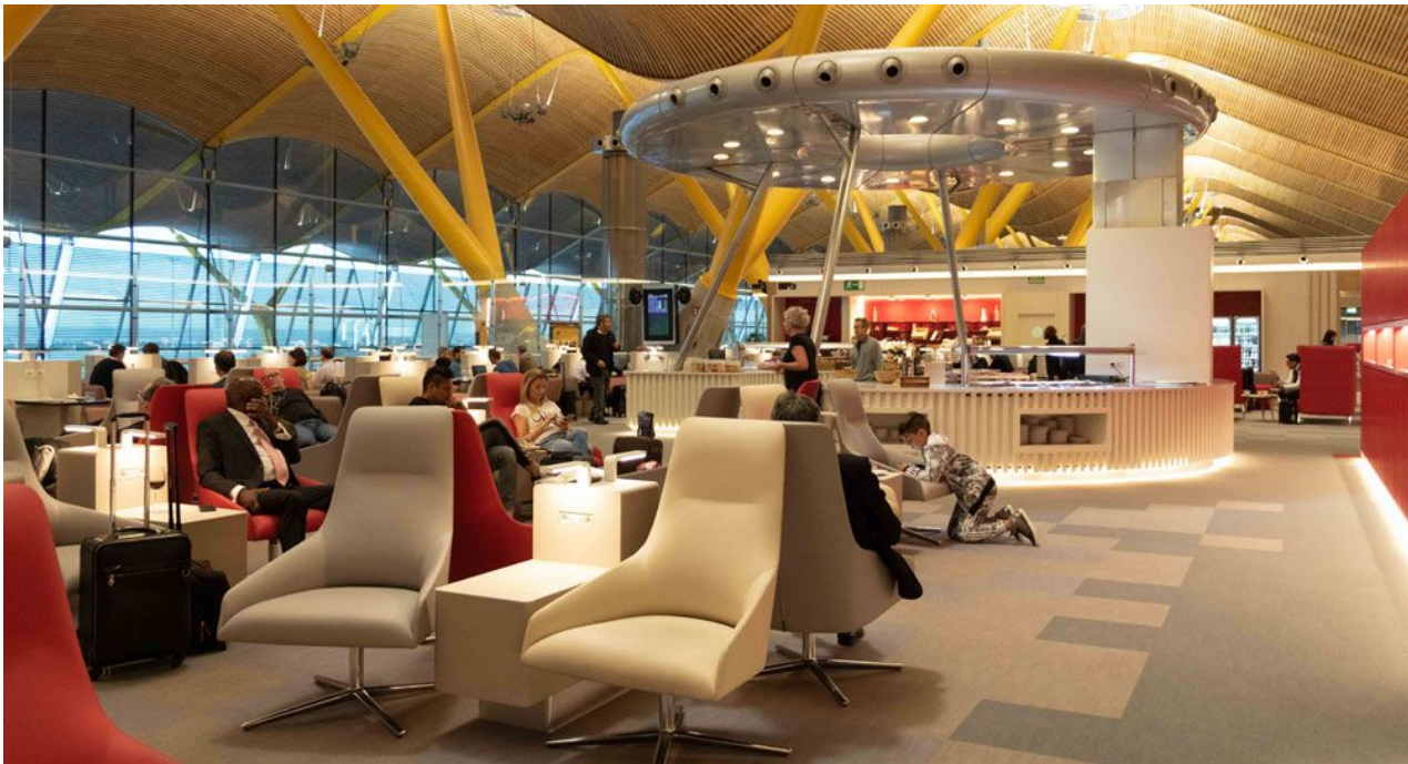
Sala Premium Lounge Dalí por Estudio Lamela

Tras la reforma, Estudio Lamela presenta la nueva sala VIP de Iberia de la T4 de Barajas; cuenta con 2.000 m2 y 455 asientos e incluye duchas, WiFi ilimitado, camas, sala de juegos para niños, autoservicio y una vinoteca