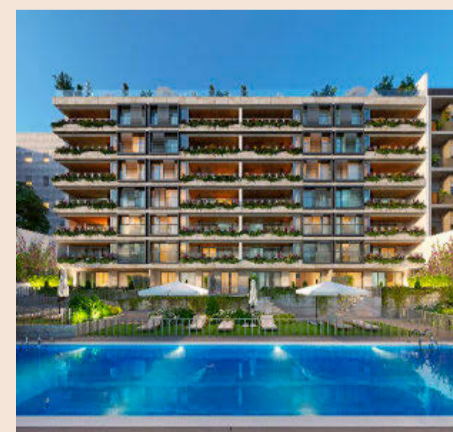
Recreación de las nuevas viviendas de lujo de Arcano en la calle Espronceda (Madrid).

La comercialización de la nueva promoción correrá a cargo de Colliers International.