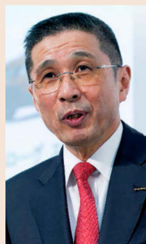
Hiroto Saikawa, consejero delegado de Nissan.

Al anunciar la ruptura de las negociaciones, FCA aludió