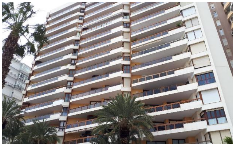
El edificio está encuadrado dentro del Movimiento Moderno de la arquitectura. /