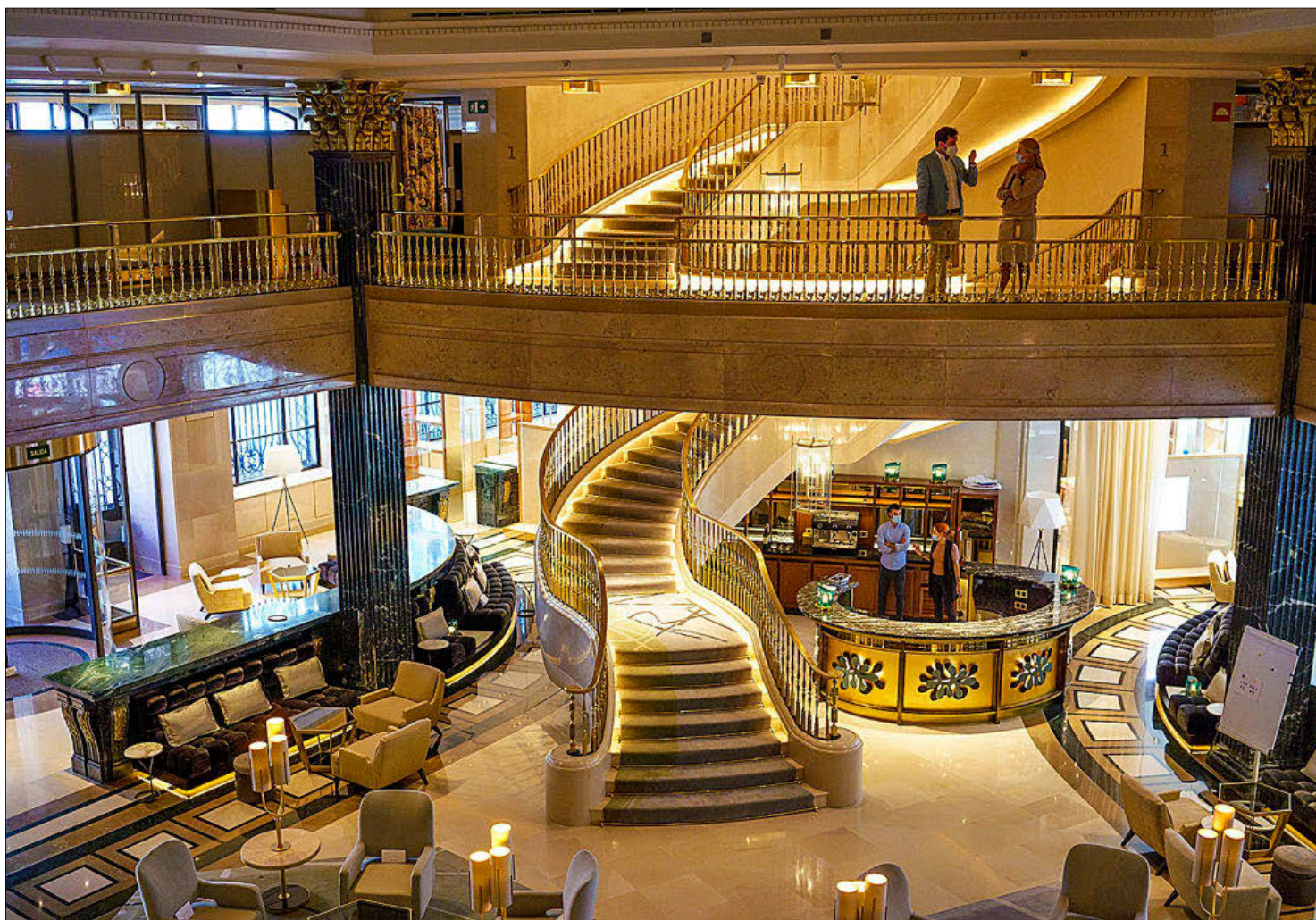
EL 'LOBBY' DEL HOTEL FOUR SEASONS. Era la antigua sala de operaciones de Banesto y se han respetado los mostradores originales. A. NAVARRETE